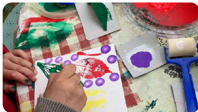
Atelier peinture La ferme de Cabrières (13)