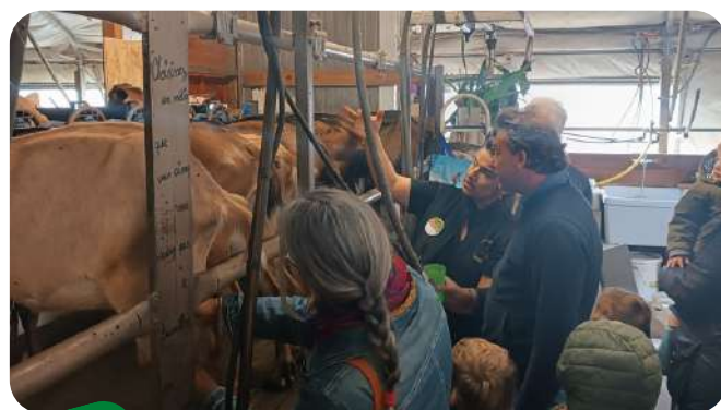
Concours de traite manuelle Fromagerie les Cabres d'Or...élie (13)