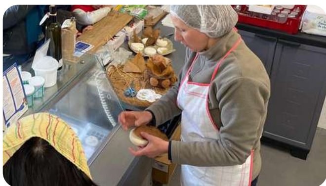
Démonstration de pliage de Banon AOP La Bellimure (84)

Petit aperçu des animations que l'on pouvait découvrir cette année :