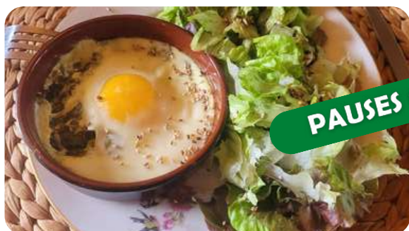
Assiette du jardin La ferme de Noé (13)