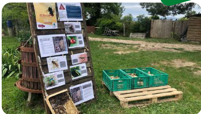
Atelier Fabrication d'un hôtel à insectes La ferme du Rouret (84)