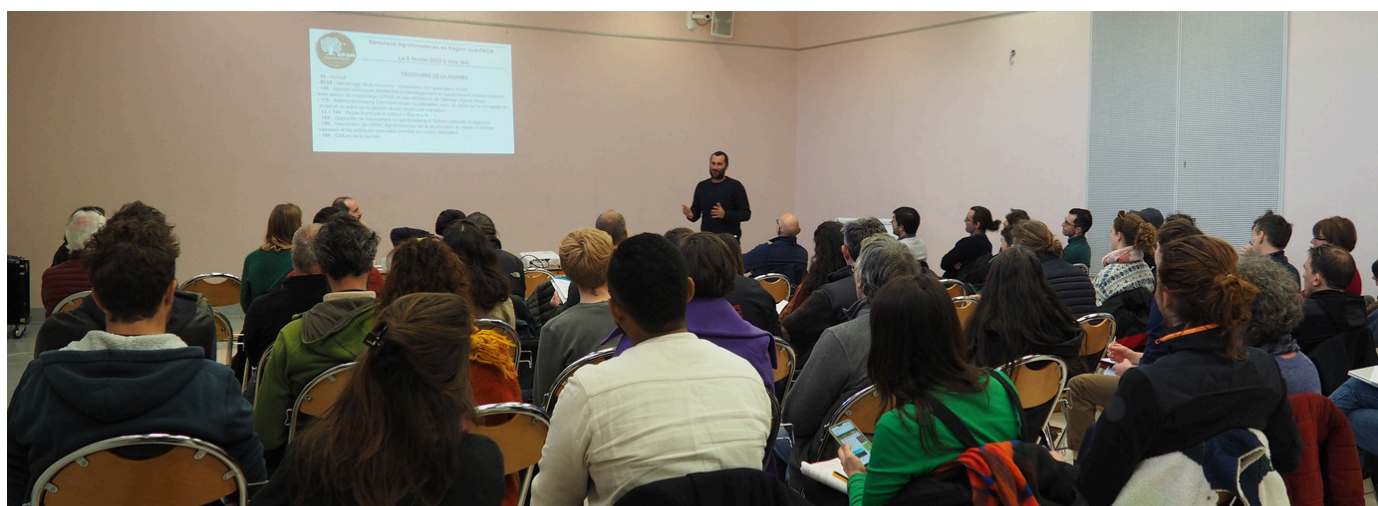
Séminaire régional APAM organisé à Volx (04) le 9 février 2023

Les agriculteurs de l'APAM ont pu s'exprimer sur leurs projets individuels et leur souhait de voir développer la thématique en Région. Des résultats techniques de projets de R&D menés avec les partenaires privilégiés de l'APAM (Scop Agroof, GRAB) ont aussi rythmé les échanges et permis aux agriculteurs d'avoir connaissance des dynamiques régionales.