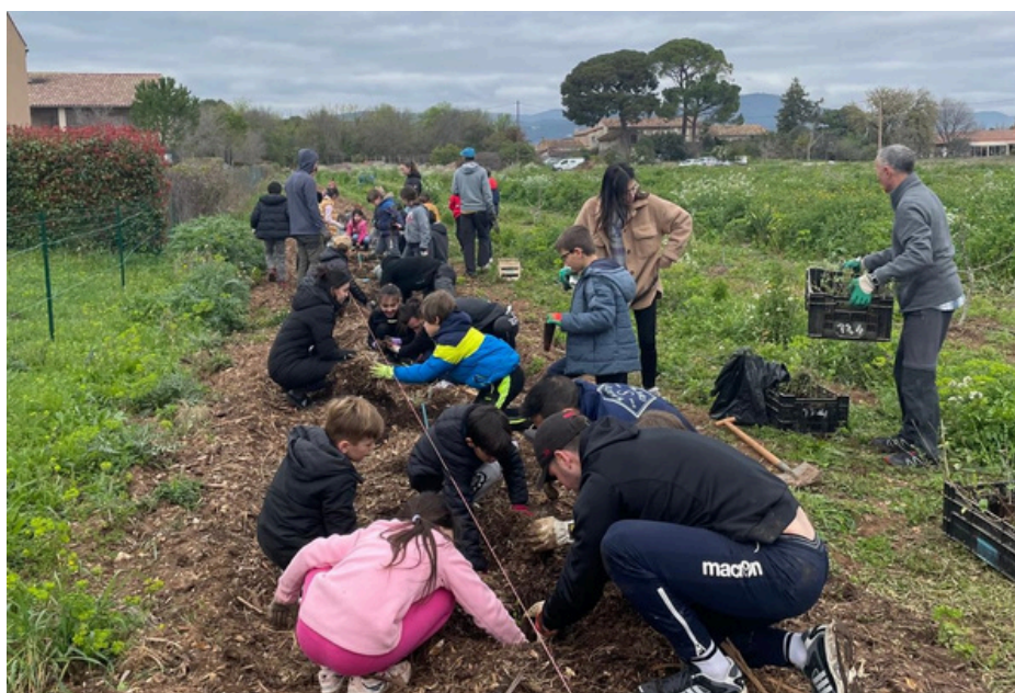
Plantation scolaire organisée hiver 2023-2024 à Solliès-Ville (83)

Le GR CIVAM PACA accompagne par ailleurs d'autres agriculteurs au travers d'autres dispositifs (MyTree, Des Enfants et des Arbres, AFAF, SAFER PACA...). La diversité des financements permet de répondre à une diversité de projets, tant au niveau des systèmes de production (maraîchage majoritaire mais aussi céréales, PPAM, arboriculture...) que de la nature de la plantation : haies périphériques, alignements intraparcellaires, etc. Plusieurs de ces chantiers de plantation sont organisés en lien avec des scolaires, primaires notamment, dans le cadre de démarche volontaire des écoles pour sensibiliser les jeunes à l'environnement.