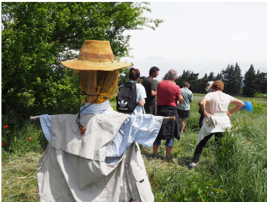
"De ferme en ferme", Le Thor, avril 2023