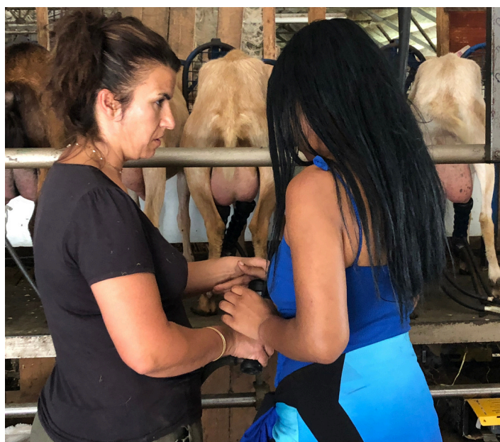
Séjour avec la Protection Judiciaire de la Jeunesse, juin 2023