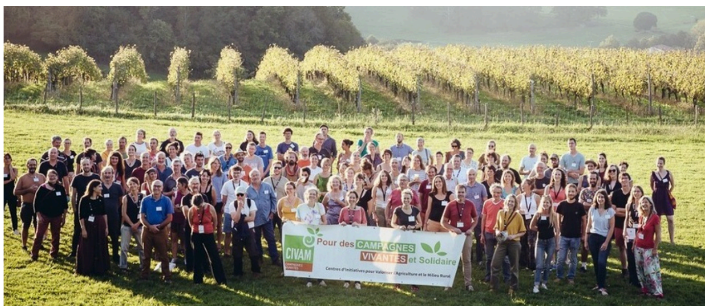
Rencontres nationales CIVAM 2023, Pays Basque, octobre 2023