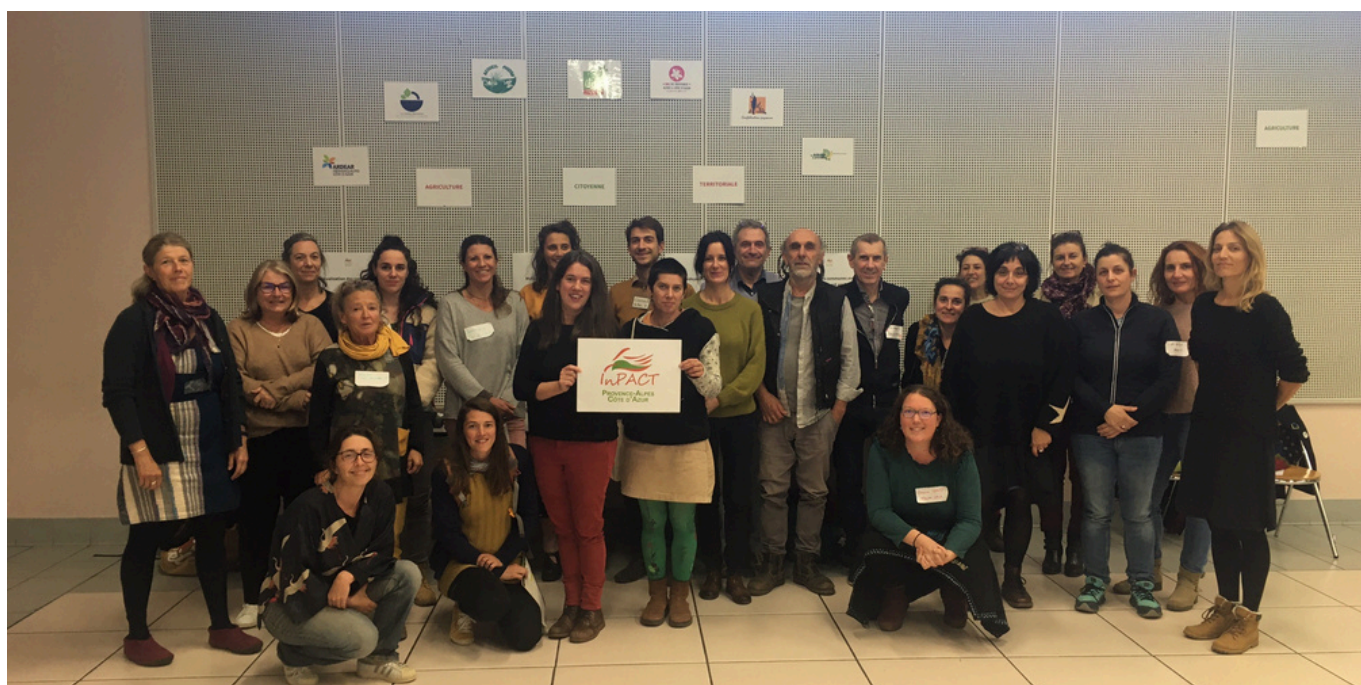
Séminaire régional InPACT PACA, Volx (04), novembre 2023

Une synthèse des propositions faites lors des ateliers de travail du séminaire InPACT PACA en novembre 2023 est une base pour une feuille de route 2024 - 2026 à construire lors du prochain comité de pilotage d'InPACT PACA en faisant un choix sur les actions proposées. Cette feuille de route permettra de cibler les actions d'animations à mettre en œuvre par les membres du pôle InPACT PACA avec l'appui de l'animateur. Il est proposé qu'un séminaire ait lieu tous les 3 ans pour réactualiser la feuille de route.