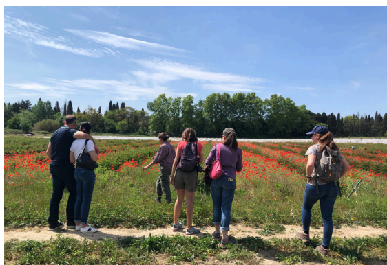
"De Ferme en Ferme", Saint Rémy, avril 2023