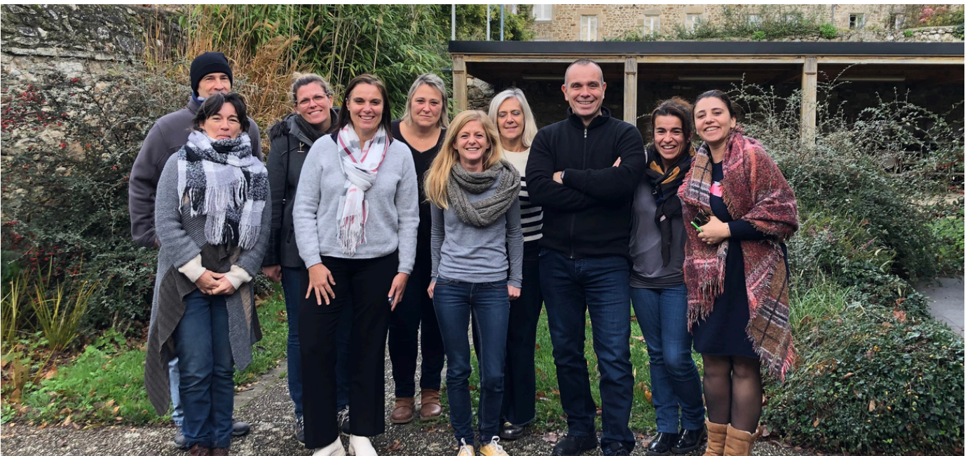
Rencontres de l'Accueil Social, Saint Jacut (Bretagne), novembre 2023

Journées de l'Accueil : en partenariat avec Accueil Paysan, 3 journées de rencontres ont été organisées en novembre à proximité de Saint-Malo. 6 producteurs du réseau RACINES PACA, l'animatrice et 3 représentants de SOS Villages d'Enfants y ont participé. L'occasion d'échanger avec d'autres territoires porteurs d'accueil et de témoigner du partenariat fort mis en place avec SOS Villages d'Enfants.