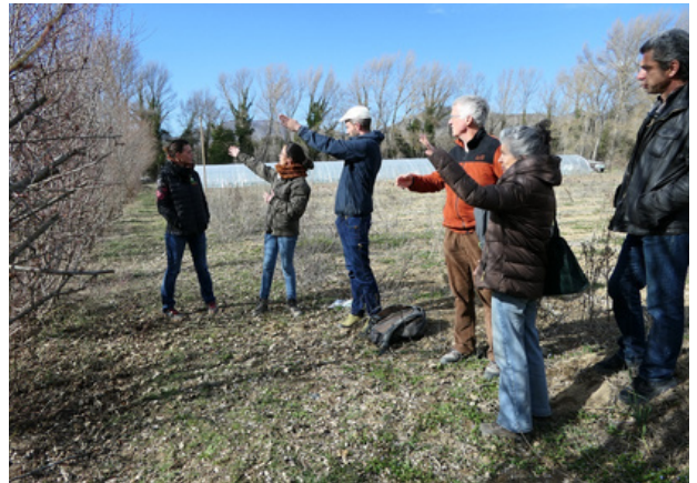
Formation à destination d'agriculteurs à Digne (04), mars 2023

Par ailleurs, le GR CIVAM est impliqué dans le cadre du "Marathon de la Biodiversité" financé par l'Agence de l'Eau, qui porte notamment sur la plantation d'une quinzaine de km de haies autour de Digne-les-Bains (04). En 2023, le GR CIVAM PACA a formé 8 agriculteurs de l'agglomération "Provence Alpes Agglomération", puis accompagné individuellement 4 d'entre eux jusqu'aux plantations qui ont eu lieu à l'hiver 2023-2024. Ce travail se fait en lien étroit avec l'agglomération, le CEN PACA, la Chambre d'Agriculture 04 et la Scop Agroof qui intervient en binôme avec le GR CIVAM PACA sur l'accompagnement technique et la formation des agriculteurs.